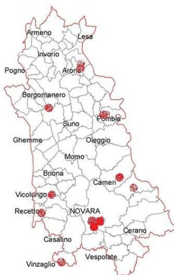
Provincia di Novara: Trafficking In rosso i luoghi relativi ad episodi di cronaca connessi al trafficking riportati dai giornali locali nel periodo 2008 – 2010.

La rete sociale appena descritta si occupa del problema sotto due aspetti fondamentali: il profilo legale-giudiziario (Prefettura di Novara, Procura di Novara, Questura) e quello assistenziale (Curia Vescovile, associazioni di terzo settore, Comuni e Provincia). Questa rete offre assistenza a diverso livello (servizi di accompagnamento, aiuto-sostegno, assistenza sanitaria, espletamento pratiche burocratico-amministrative, denuncia sociale, sensibilizzazione, etc), e, ai fini del servizio civile, sono particolarmente interessanti due realtà in accordo di partenariato con la Provincia, che hanno già usufruito in passato del lavoro degli obiettori di coscienza e dei volontari in servizio civile e sono pertanto in grado di accogliere giovani in servizio civile con un alto profilo qualitativo: la già citata Ass. “Liberazione e Speranza” e l'Ass. “Mamre”.