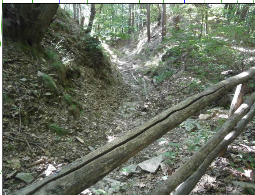
Foto 1 - dalla strada Comunale corta per Luciago