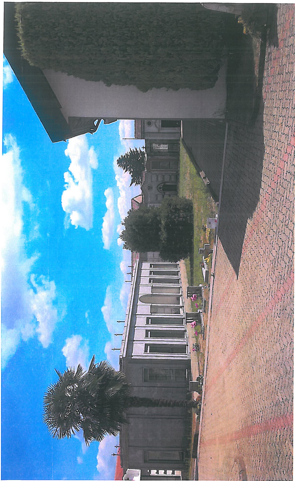
Vista lato NORD foto n. 2