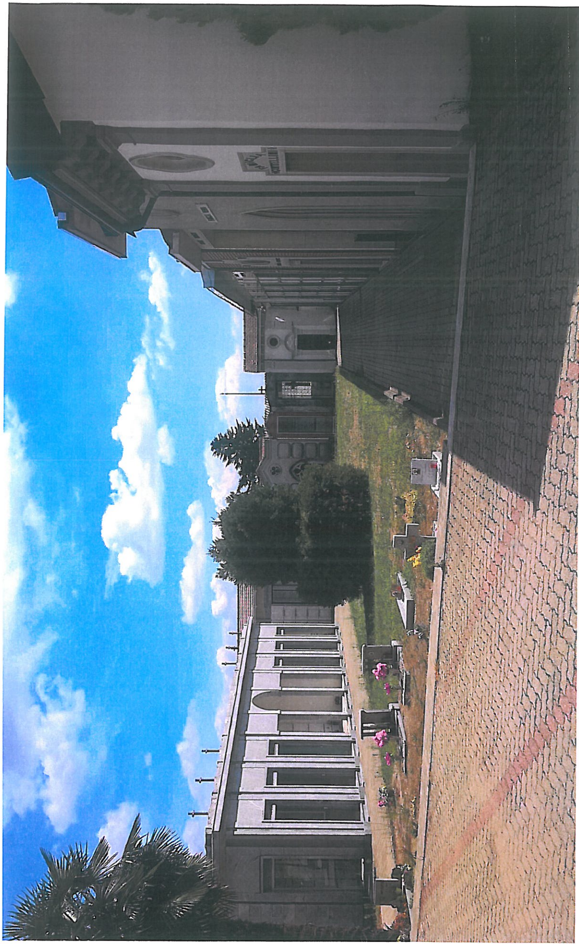
Vista lato NORD foto n. 3: particolare esteso ai vialetti pedonali esistenti, mantenuti in progetto