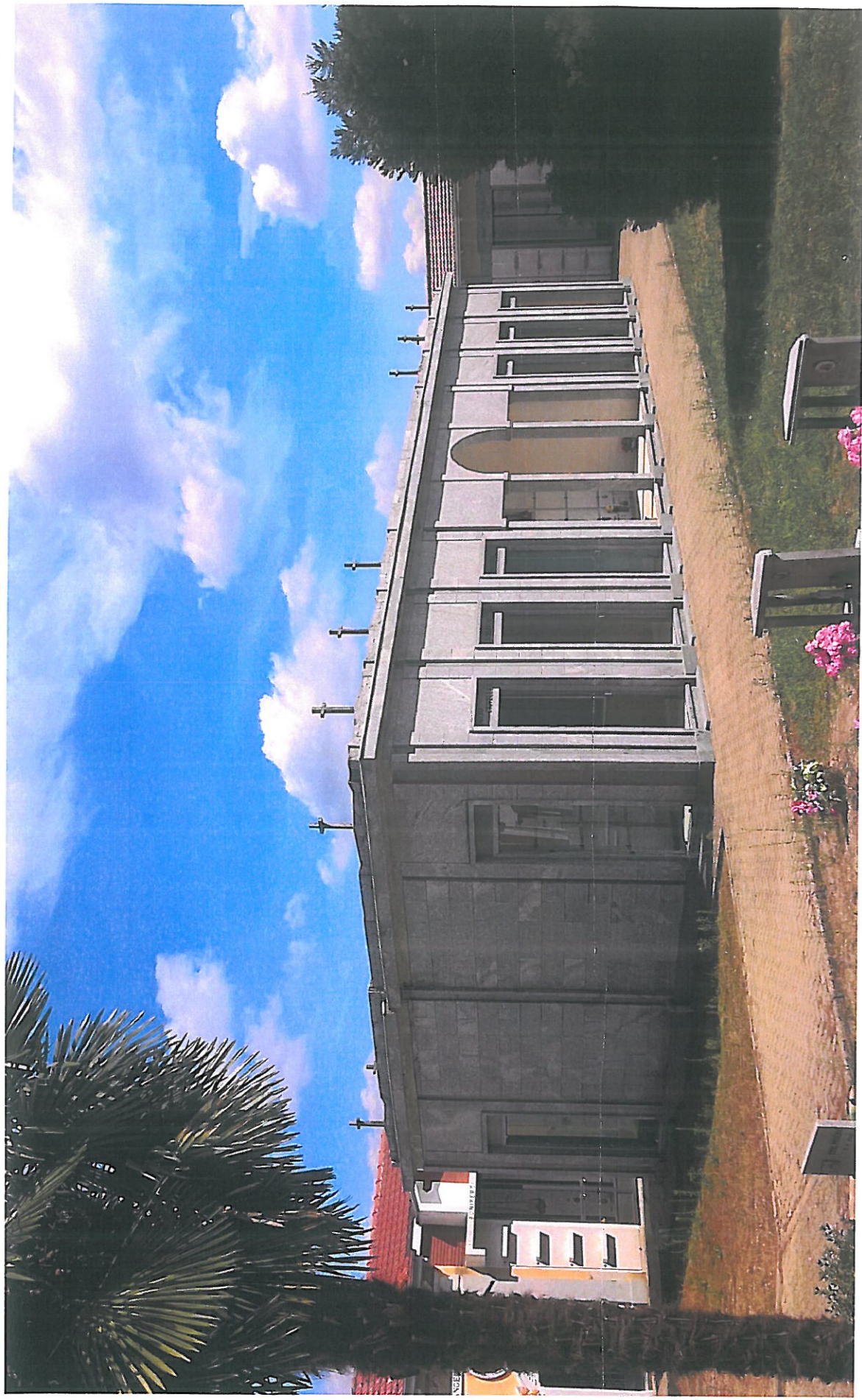
Vista 1 lato NORD edificio funerario esistente di tipologia analoga all'edificio in progetto