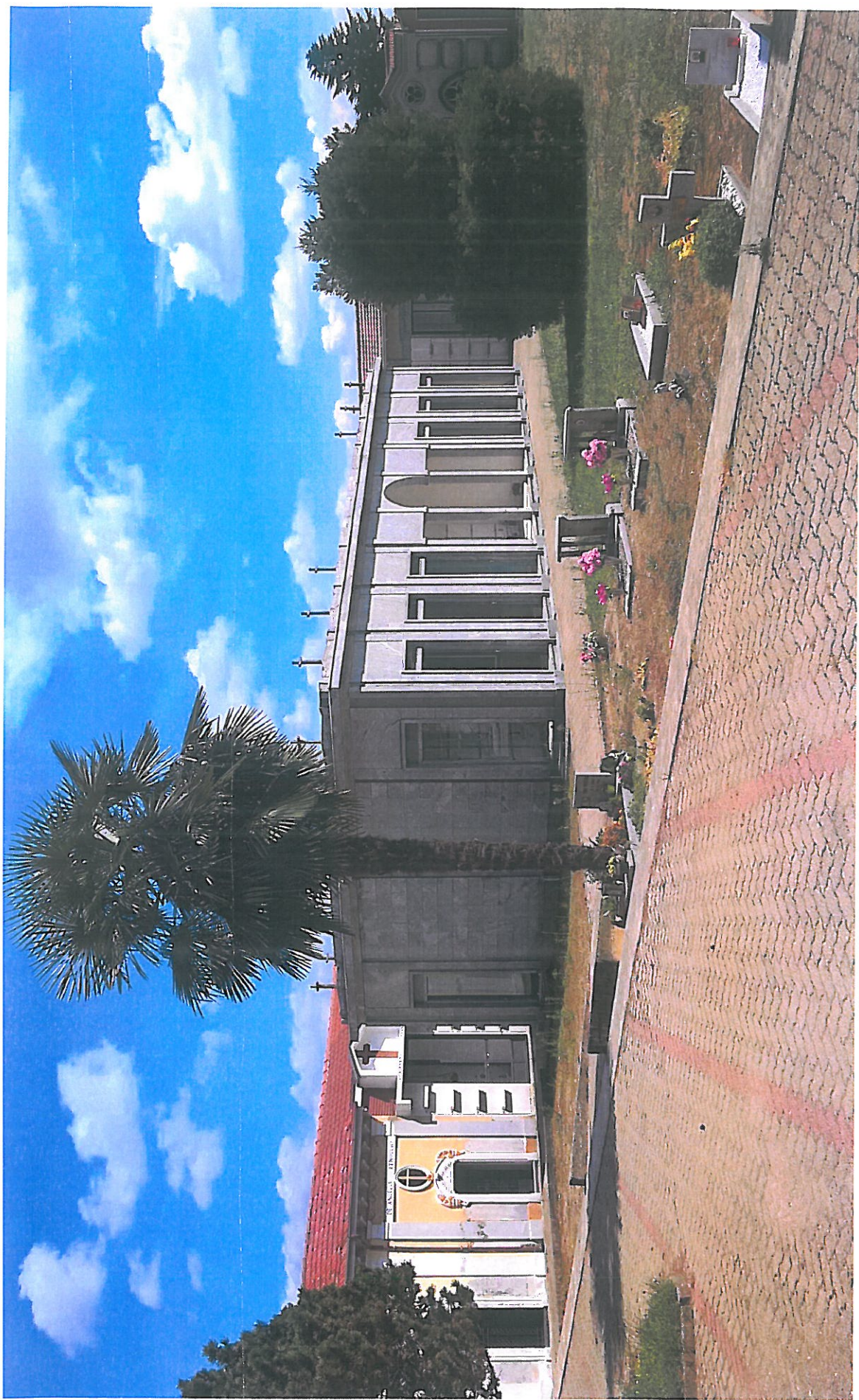
Vista lato NORD foto n. 6