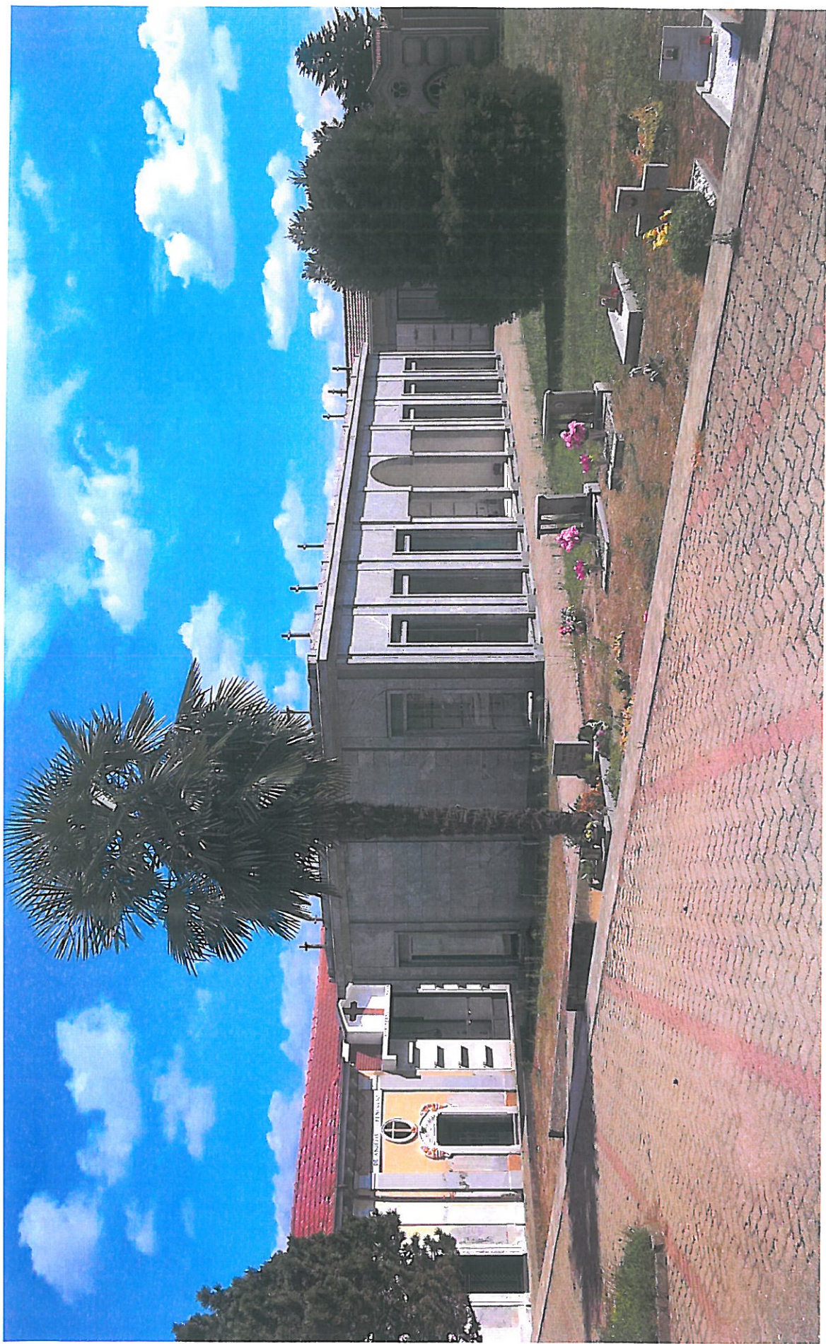
Vista lato NORD foto n. 5 allargata al contesto perimetrale esistente