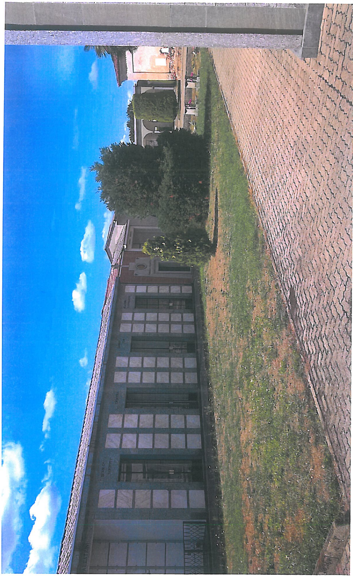
Vista 6 lato SUD-OVEST: particolare area oggetto di intervento