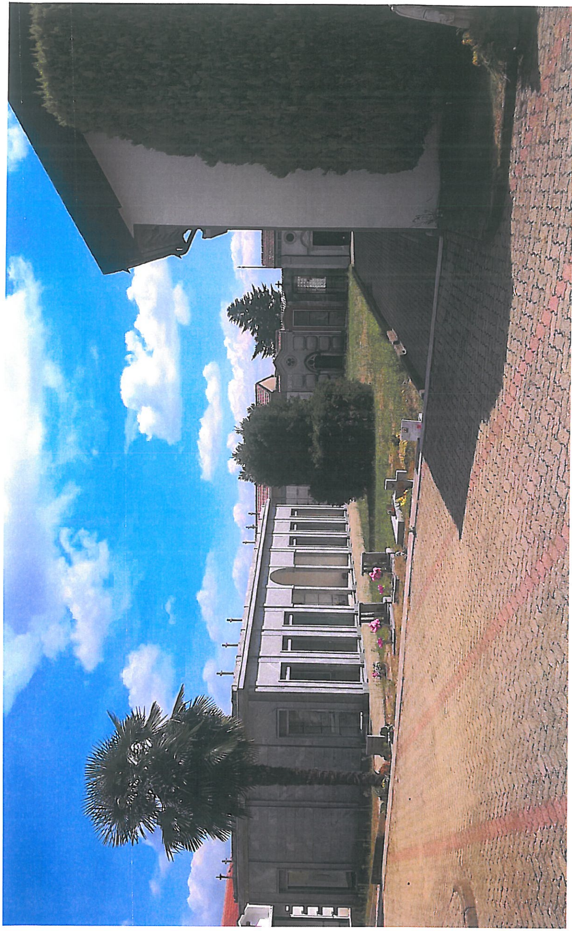
Vista lato NORD area oggetto di intervento (attuale giardino/verde) con tipologia edilizia esistente (lato sx)