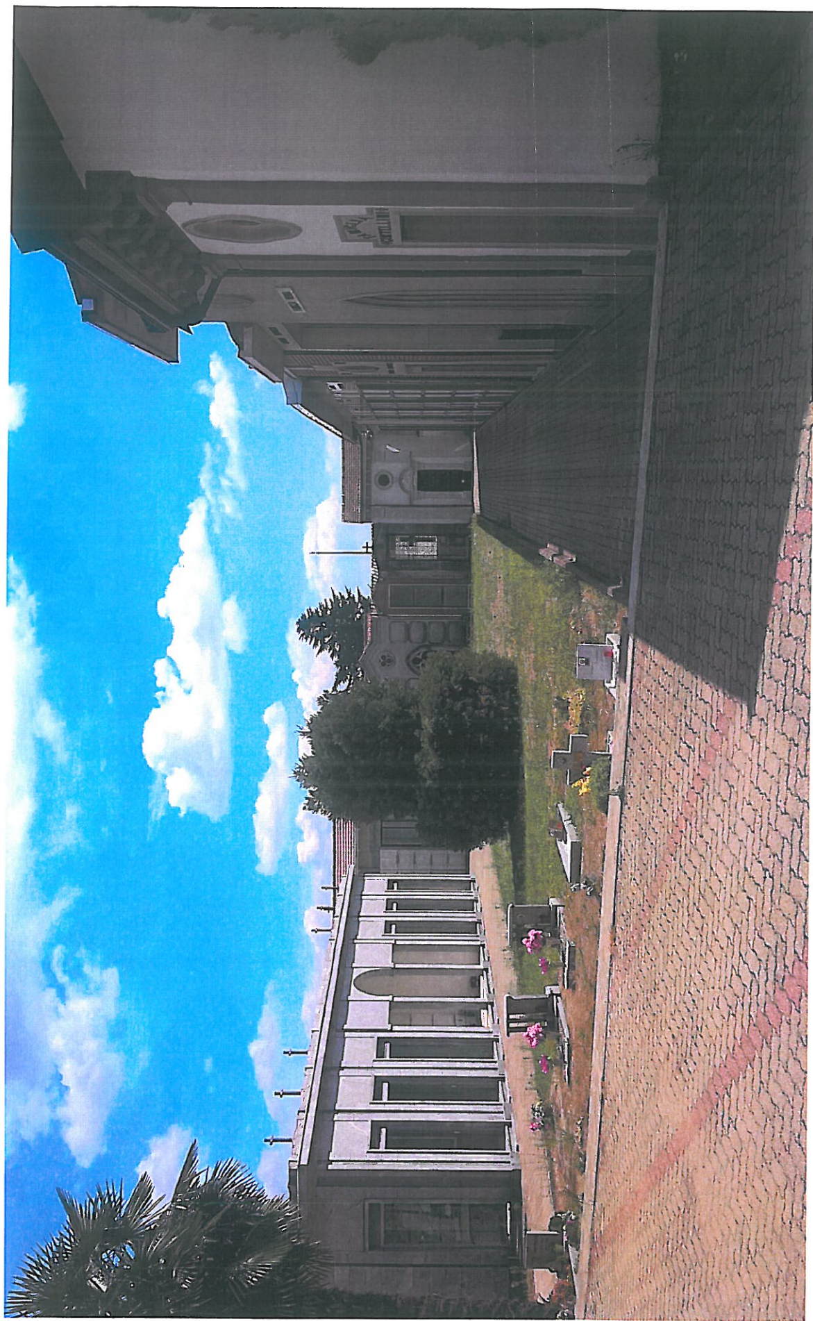
Vista lato NORD foto n. 4