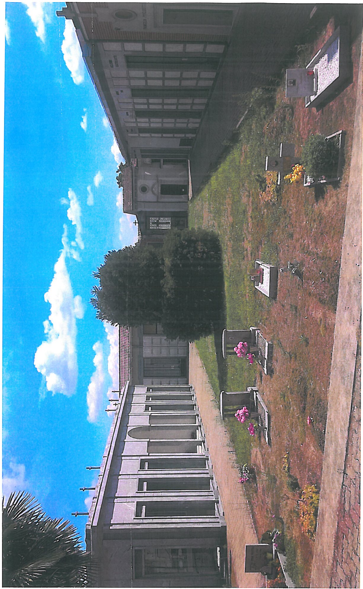
Vista lato NORD foto n. 7: particolare area oggetto di intervento