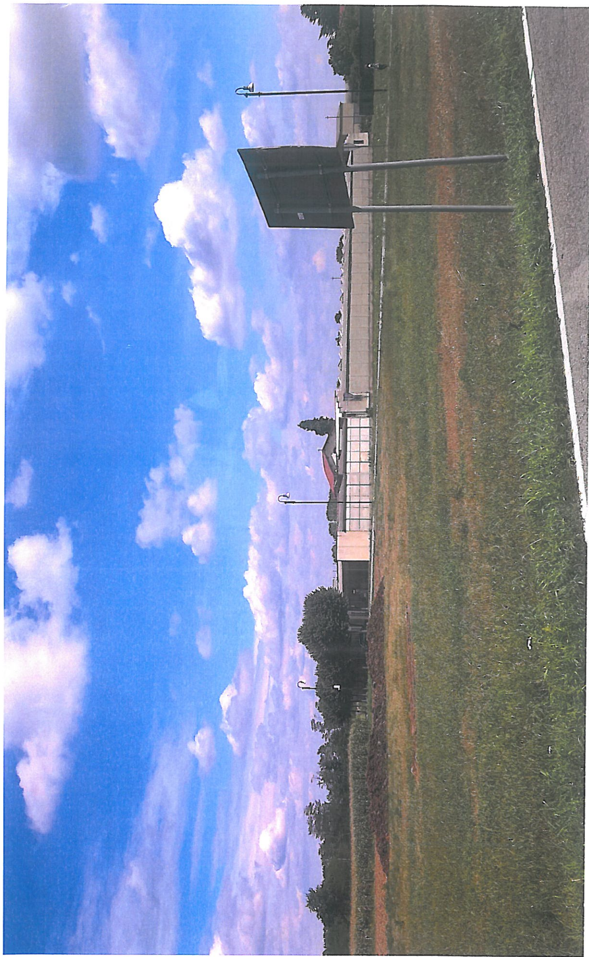
Vista esterno cimitero da strada provinciale