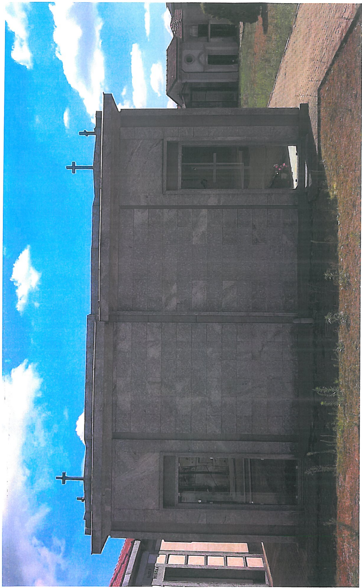
Vista 2 lato NORD-EST edificio funerario esistente di tipologia analoga all'edificio in progetto