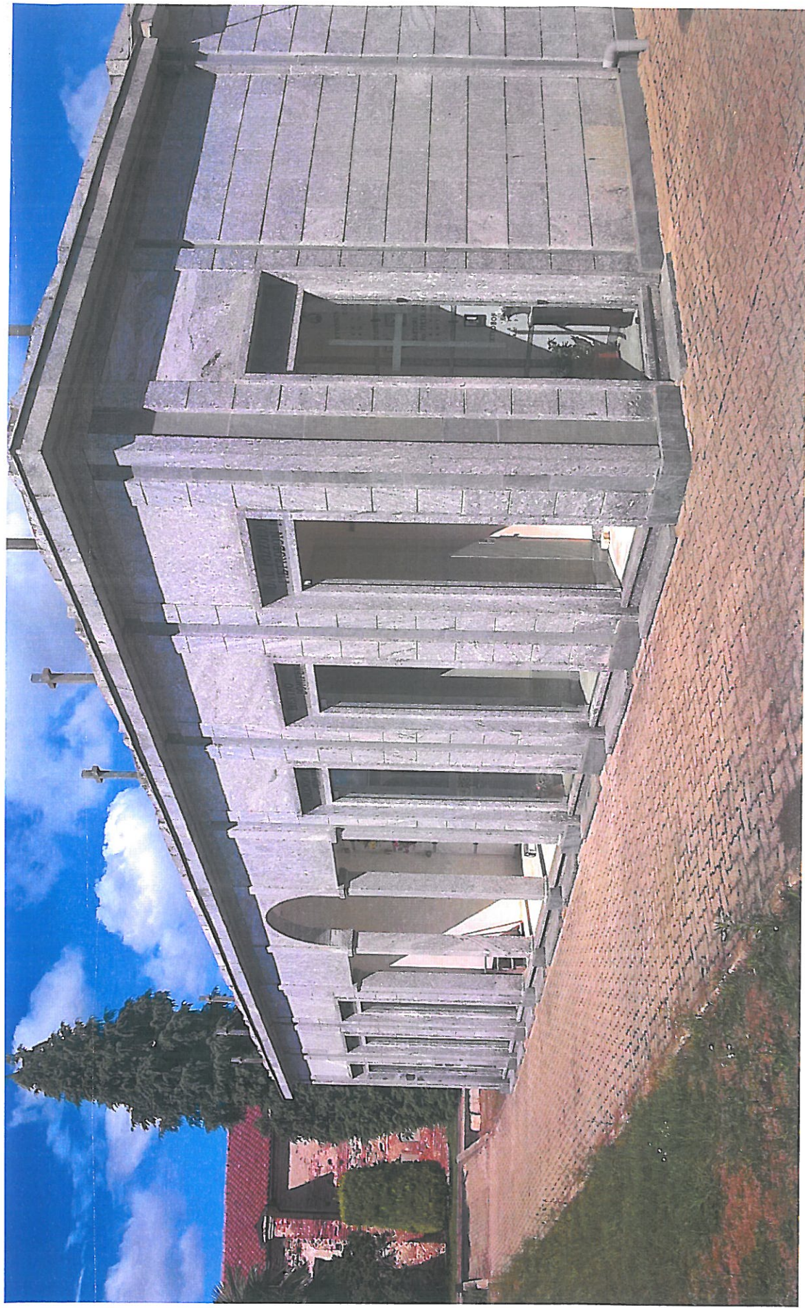
Vista 5 lato SUD: particolare edificio esistente analogo all'edificio in progetto