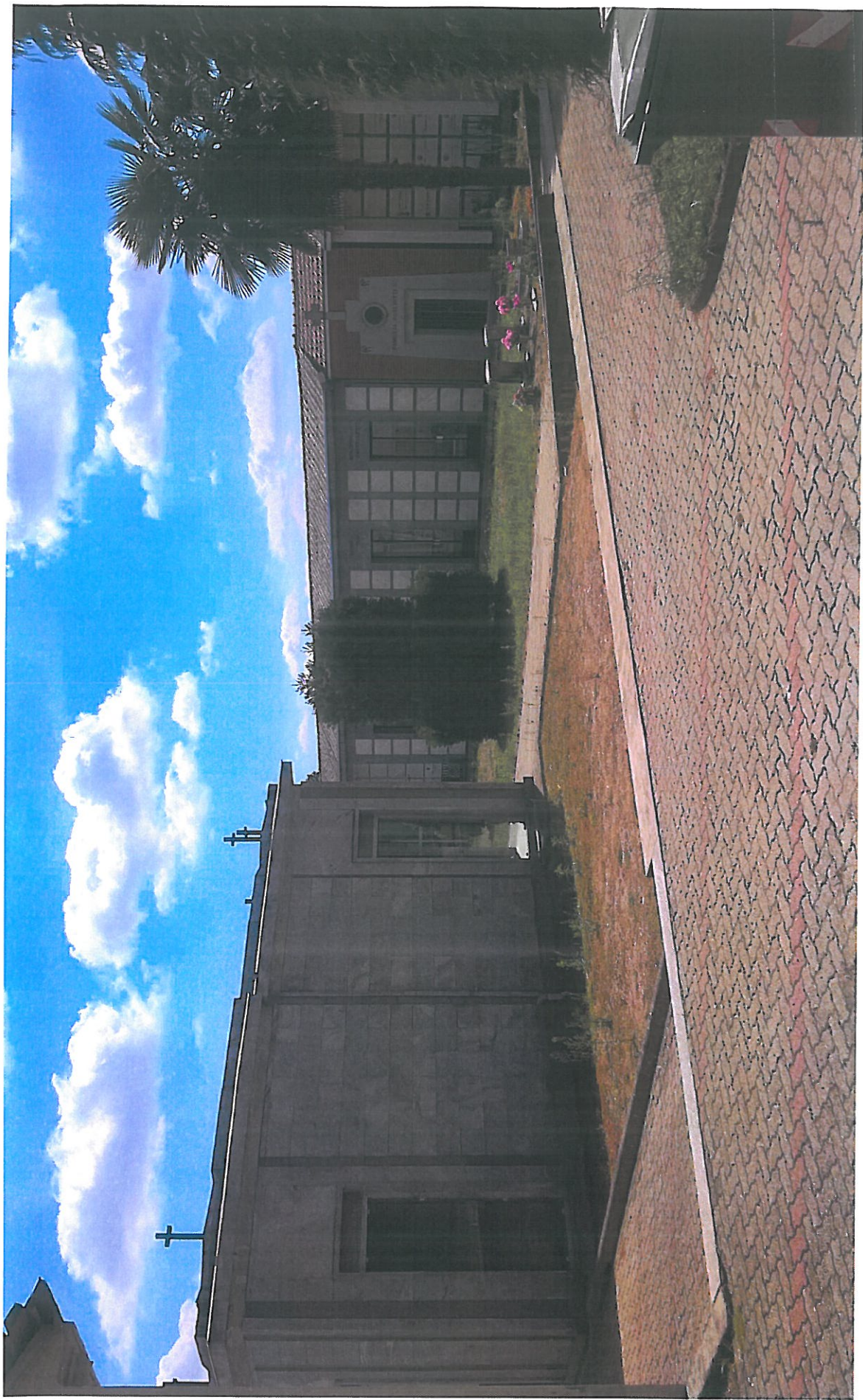
Vista 3 lato NORD-EST edificio funerario esistente analogo all'edificio in progetto ed area oggetto di intervento