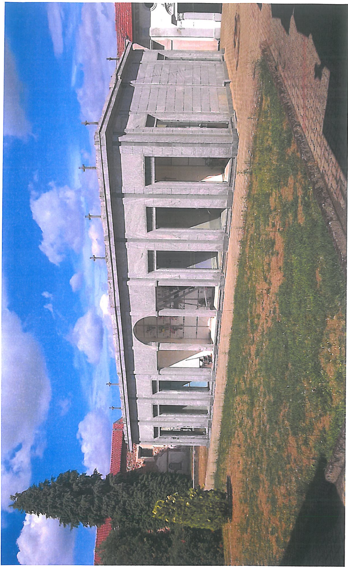
Vista 4 lato SUD-OVEST: area di intervento ed edificio funerario esistente analogo all'edificio in progetto