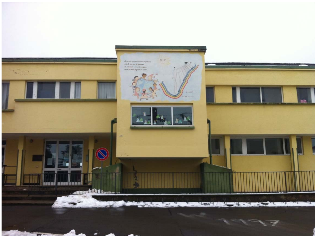
Fronte principale con l'accesso pedonale sulla sinistra