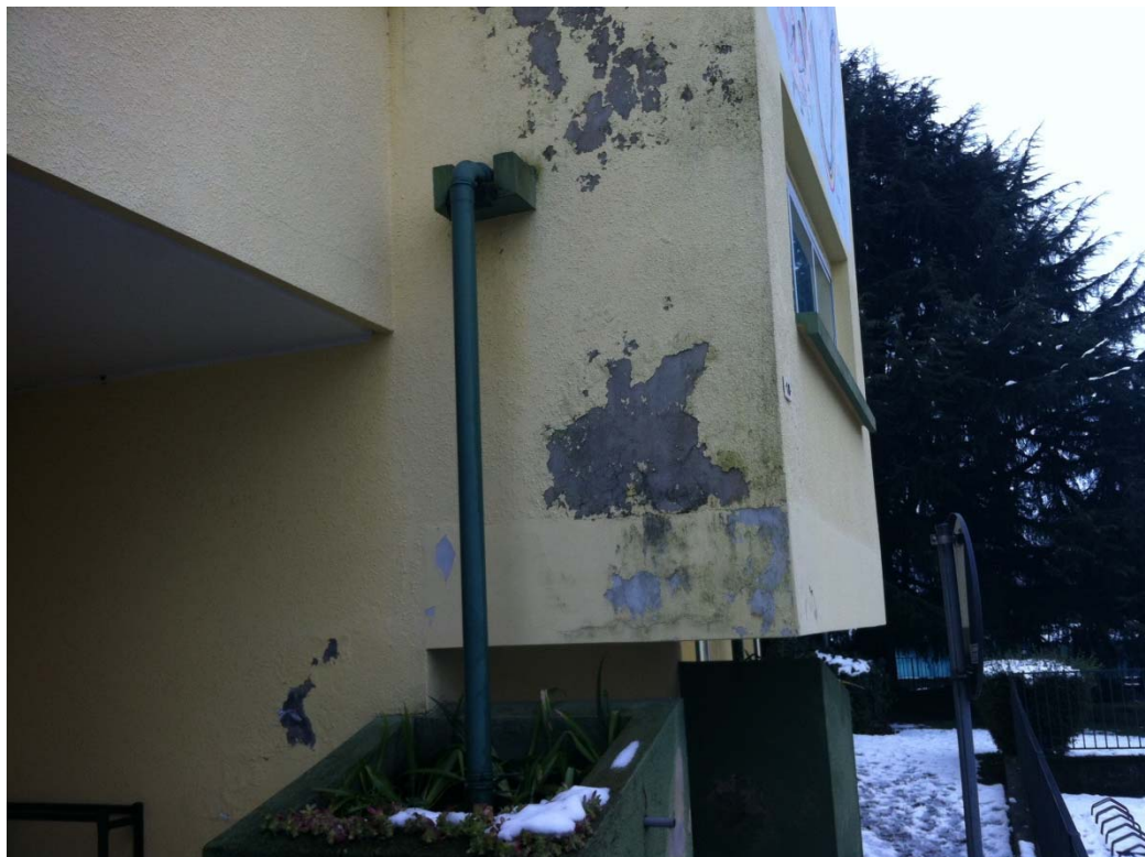
Pluviali e grondaie da sostituire