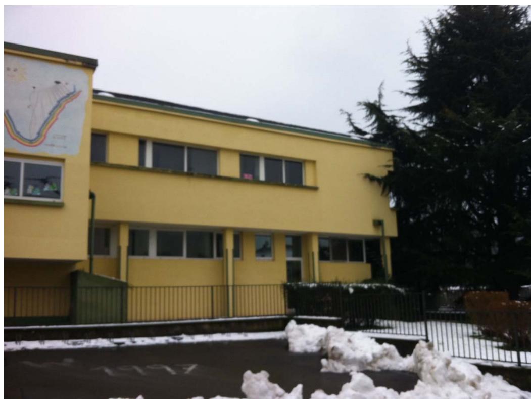
Fronte occidentale prospiciente Via Partigiani