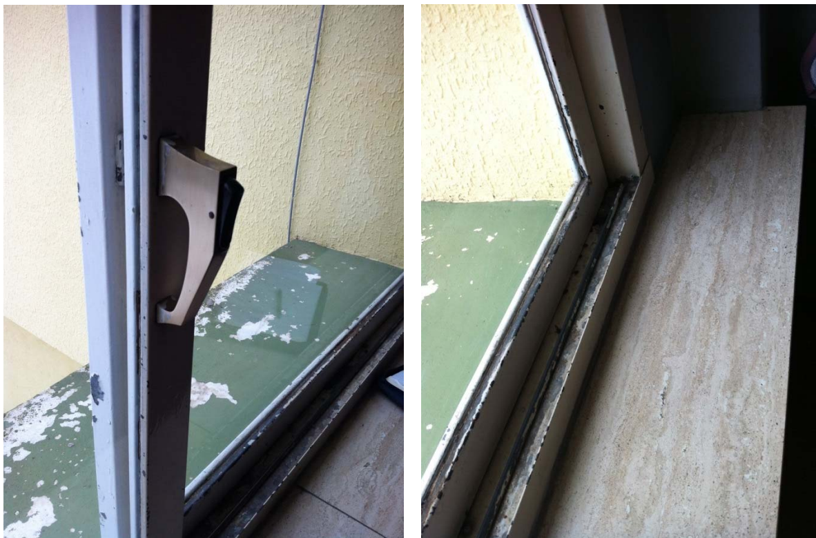
Dettaglio dei serramenti in metallico senza taglio termico, obsoleti e logori.