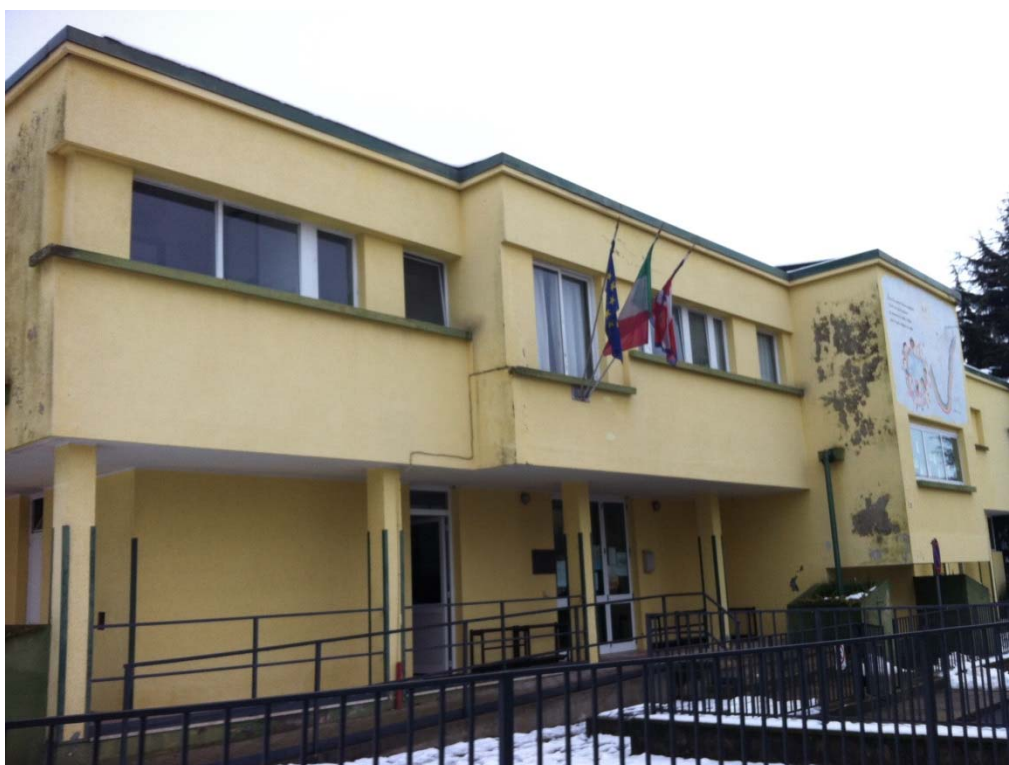
Fronte ovest con il portico di ingresso