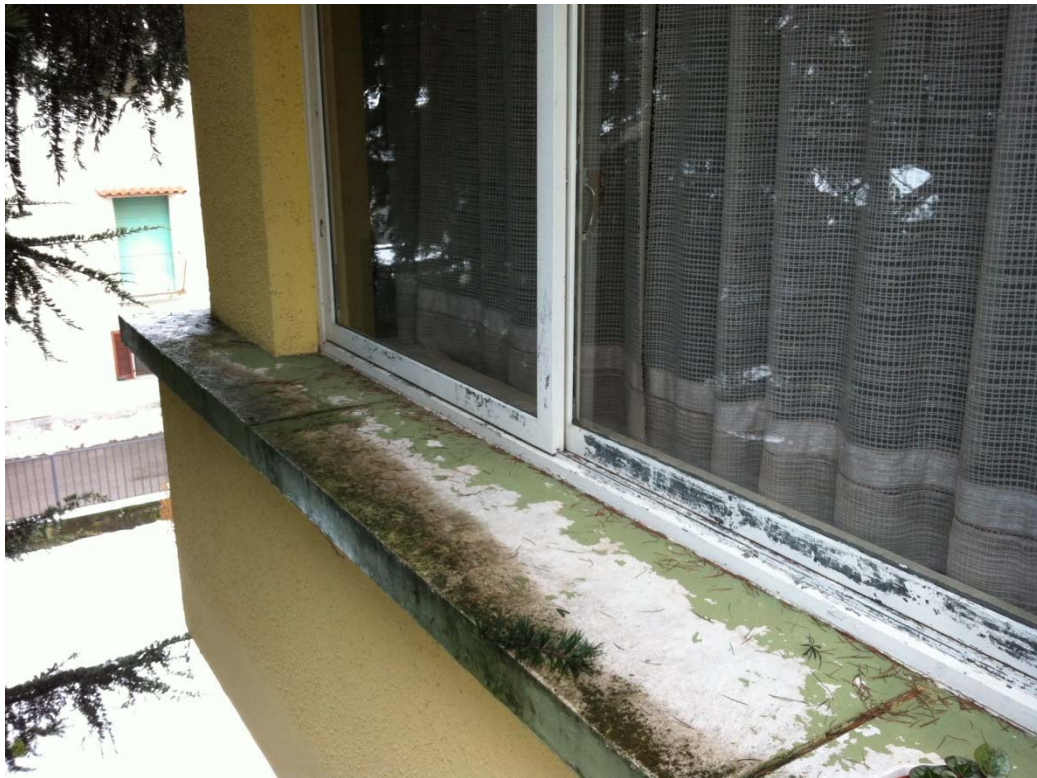
Davanzali pericolanti da sostituire