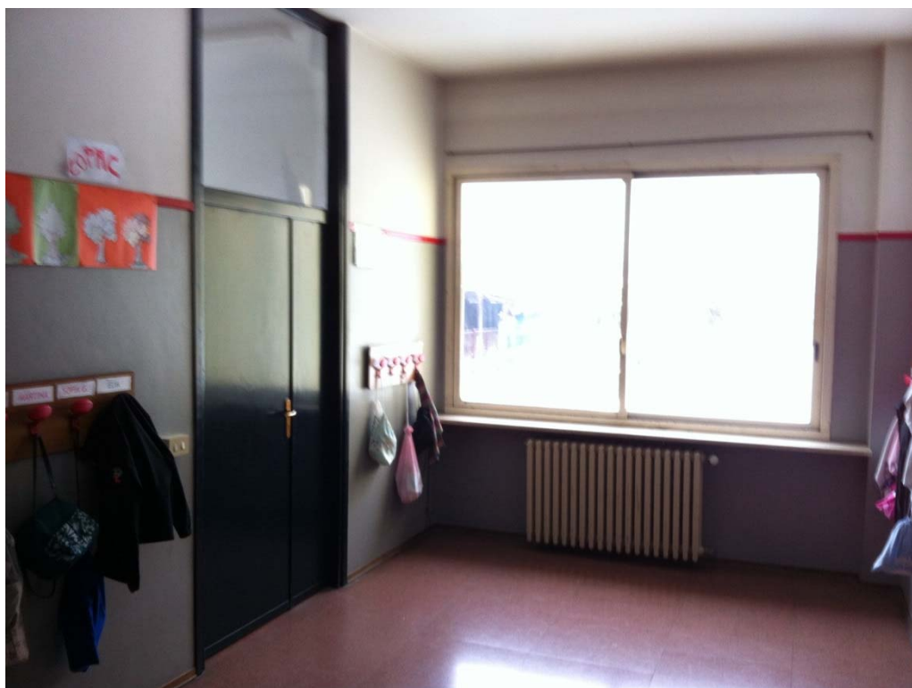
Corridoio al primo piano con le porte con sopraluce e i serramenti da sostituire