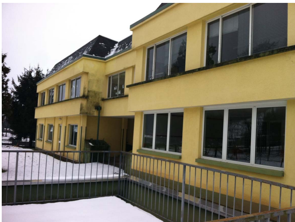
Fronte orientale con l'area verde ad utilizzo della scuola