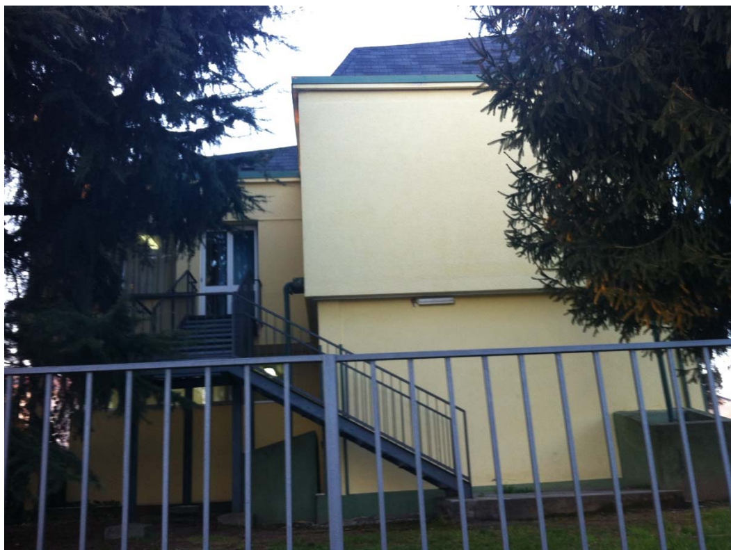
Fronte meridionale con la scala di emergenza